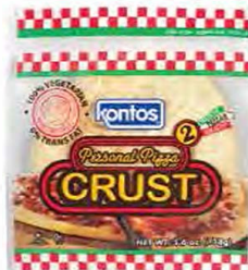
2 Count Personal Pizza