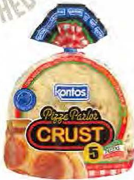
Pizza Parlor Crust • Plain